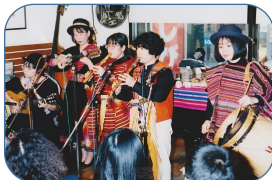
マルキチャイバンド (ラテンアメリカ民族音楽バンド)