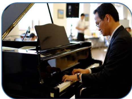
マイ・カーン (ピアノ)