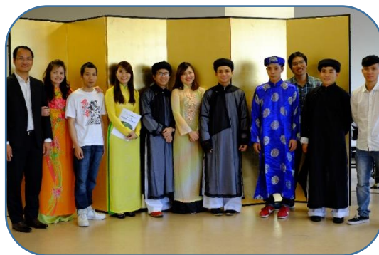
セシリア合唱団 (ベトナム人合唱団)