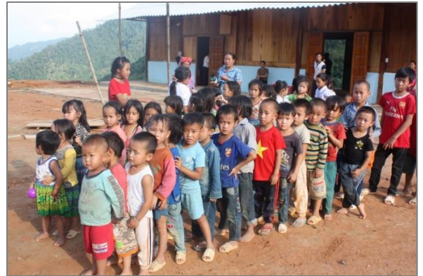
(Ta Lanh 村の赤土円錐台広場 写真後ろの地面の向こうは深い崖)

息も絶え絶えに上り、広場にたどり着く。ここに、そのまた上流から川の水を引いて、各家庭に上水を供給しようという計画を支援する。村のリーダーたちは、図面を前に熱心に説明している。来年は、赤土の円錐台のようなこの土地で、蛇口から水が出るのを見られるのかと思うと興奮した。