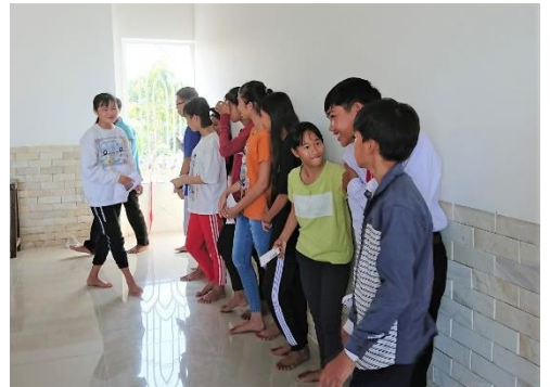
(Co Trang 奨学金を授与されて)

今回の訪問で一番印象に残ったのは子供達です。奨学金の授与で集まった子供達はみな明るく仲間同士で活発におしゃべりあり遊びあり。授与式では安藤さんの話に真剣に耳を傾け喜びに溢れていました。奨学金は続けることが使命であり、彼らを見て何としても続けると決意を新たに、奨学金をスタートさせて良かったと心より思いました。